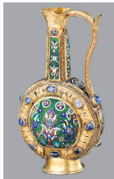
➤ Aiguière dite de Charlemagne, IX e siècle Une pièce emblématique du trésor, en émail cloisonné sur or, don d'un personnage de haut rang, mais probablement pas Charlemagne.