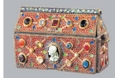
➤ Coffret reliquaire de Teudéric, VII e siècle Les noms des cinq personnages impliqués dans la fabrication de l'objet sont inscrits au dos.