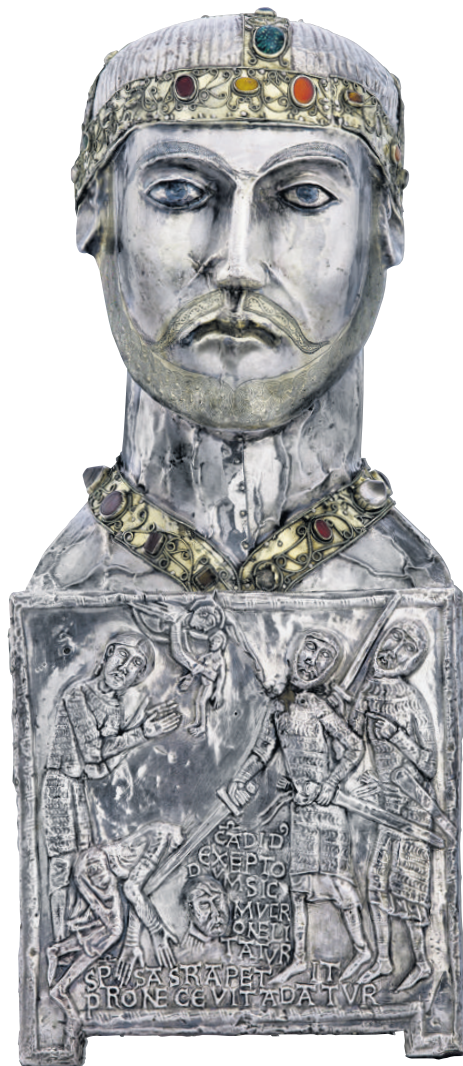
➤ Chef reliquaire de saint Candaïde, vers 1165 Candaïde était le sénateur de soldats massacrés sur ordre de l'empereur Maximilien. Cette tête en argent, grandeur nature, contient ses reliques. On y a aussi retrouvé des restes de Terre sainte.

L'exposition sert d'avant-goût aux festivités du 1500 e anniversaire de l'abbaye de Saint-Maurice qui commenceront le 22 septembre. A Paris, les reliquaires seront vus en un jour par bien plus de visiteurs qu'ils le sont en une année à Saint-Maurice :